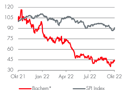
Kursverlauf seit einem Jahr (indexiert)

Fazit: Bachem gibt den neuen Produktionsstandort in der Nordwestschweiz bekannt und siedelt neu neben Lonza und Novartis im Sisslerfeld (Aargau) an. Bis 2030 entstehen vorerst 500 neue Stellen, langfristig sollen es im Aargau bis 3'000 sein.